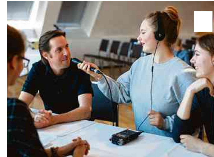
Das KultCrossing Projekt „FuSch – Funk und Schule“

Es gibt dafür noch keine fertigen Konzepte. Wir sind gerade dabei, das Profil dieser Talentschulen zu erarbeiten. Meine Idee ist, im Rahmen eines Wettbewerbs diese Schulen zu bestimmen, die dann eine besondere Förderung erhalten. Dabei setzen wir bewusst auch auf nicht-staatliche Bildungsakteure wie Stiftungen. Unser Ziel ist, dass die ersten Talentschulen zum Schuljahr 2018/2019 ihre Arbeit aufnehmen. Sie haben Recht, dass wir zunächst einen Akzent auf die MINT-Fächer setzen wollen. Das ist aber nicht exklusiv zu