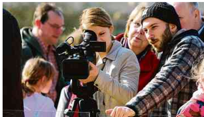
Intensive Wahrnehmung durch eigenes Filmen.

Doch warum eigentlich braucht die Schule neben ihrem obligatorischen Fächerkanon mehr Kultur? Der Darmstädter Elitenforscher