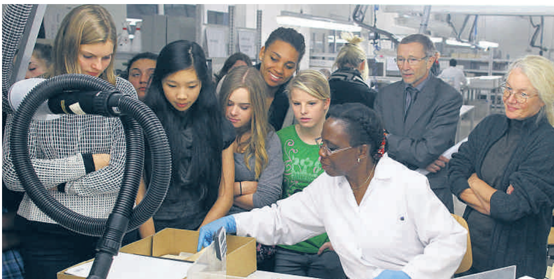
Die Schüler nahmen an einer Führung durch das Restaurierungs- und Digitalisierungszentrum des Historischen Archivs teil.

Der Nutzen von Archiven wurde schnell deutlich, weil nahezu jeder